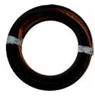
WZ0009 x 10m