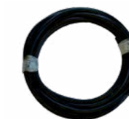
WZ0003 x 0,6m